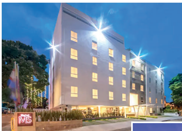
HOTEL MS CIUDAD JARDIN Carrera 101 No 15°-35

https://reservations.travelclick.com/107475?RatePlanId=8703894